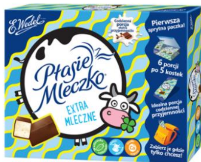
Ptasię Mleczko® Extra mleczne z dodatkiem wapnia z mleka

Kolejną propozycją dla najmłodszych jest Ptasię Mleczko® Extra mleczne z zawartością wapnia z mleka, oblane oryginalną, pyszną wedlowską czekoladą. Zaletą produktu jest innowacyjne opakowanie umożliwiające porcjowanie słodkości. W jednym opakowaniu znajdziemy 6 porcji po 5 kostek, dzięki czemu rodzice mogą kontrolować ile extra mlecznych pianek zje maluch.